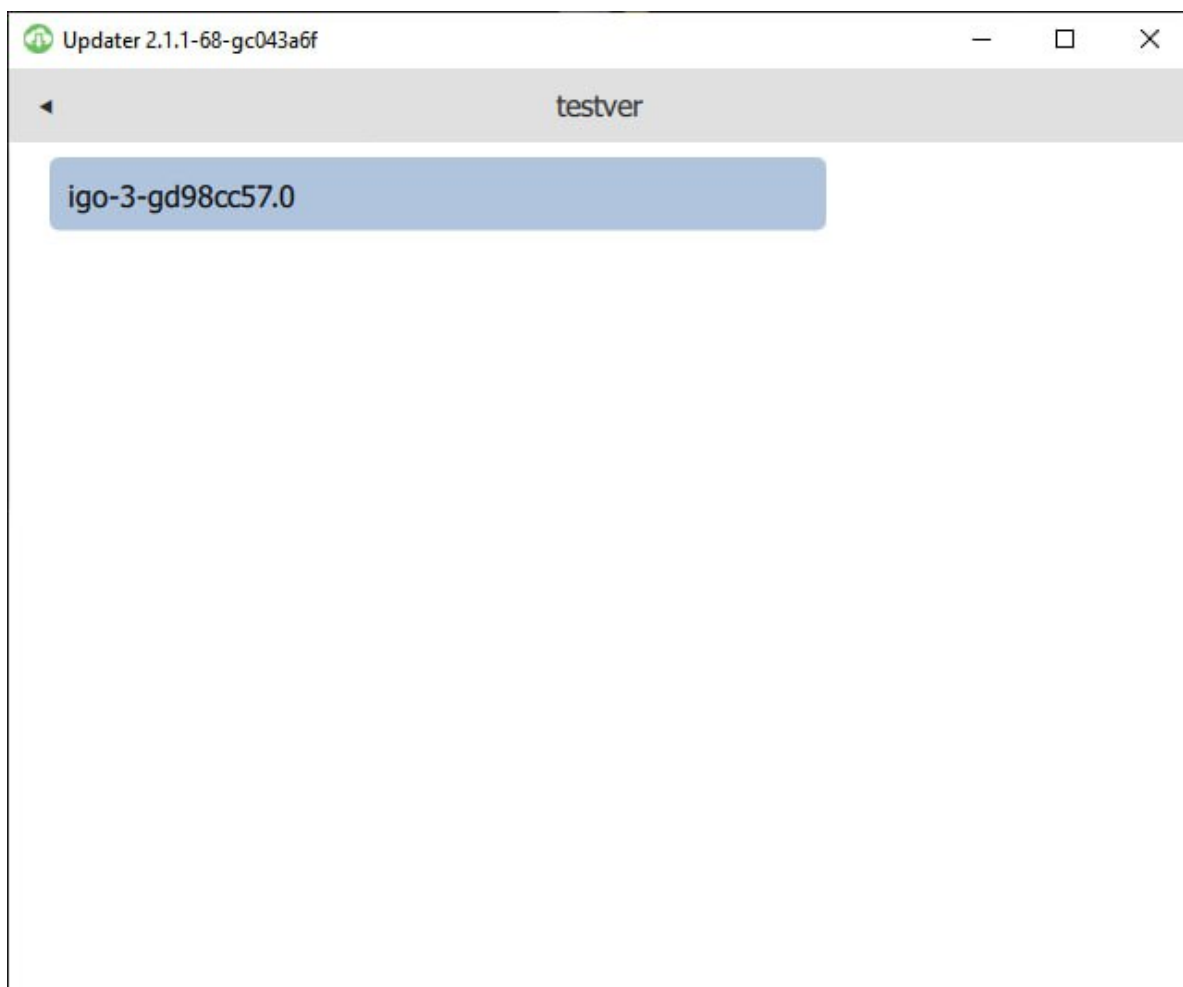
Рисунок 2 – Главное окно программы

В результате запуска программы открывается главное окно программы (рис. 2). В главном окне программы можно выбрать доступные для скачивания версии программного обеспечения.